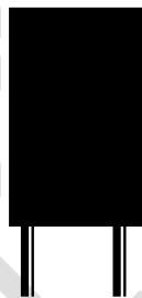
F 200 (117,5 x 170 cm) Cityformat Euroformat