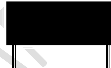
F 12 (268,5 x 128 cm) Breitformat