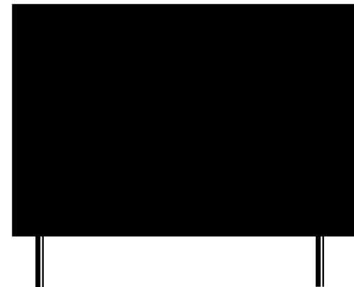
F24 (268,5 x 256 cm) Grossformat